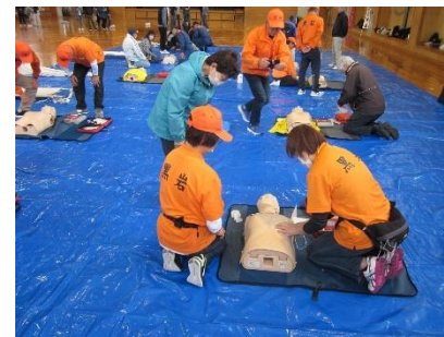
【杉妻地区防災訓練】