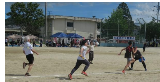
【杉妻地区大運動会】