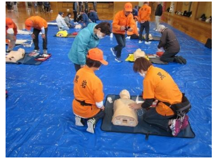
【杉妻地区防災訓練】