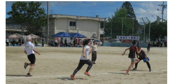
【杉妻地区大運動会】