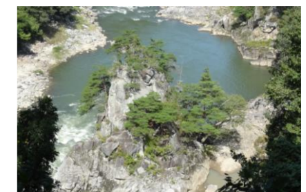
【阿武隈峡の蓬莱岩】