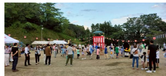
【立子山豊年盆踊り大会】