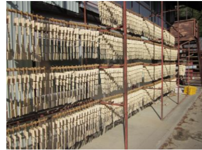
【特産物「凍み豆腐」づくり】