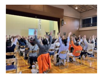
【たつごやま生き生き健康フェスタ】