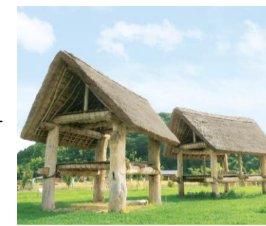
【じょーもぴあ宮畑】