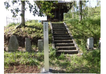
【岡本薬師堂案内標柱】