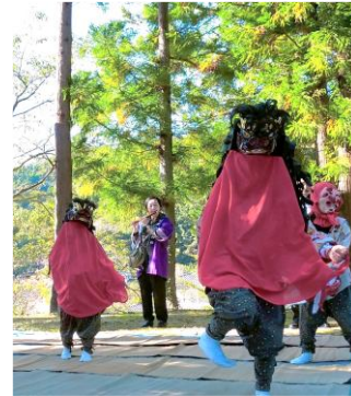
【大波住吉神社の三匹獅子舞】