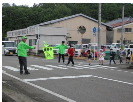
【子どもを見守る隊の活動】