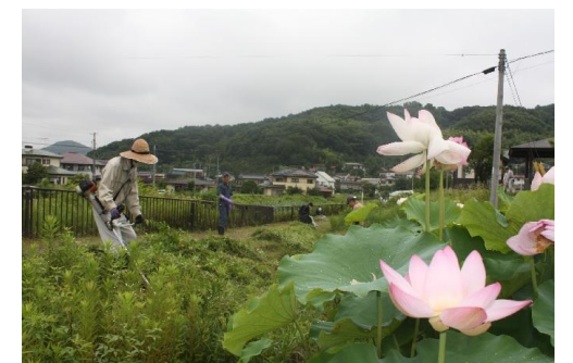
レンギョウ周辺の草刈作業の様子