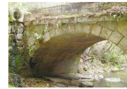
○大沢川に架かる「めがね橋」(選奨土木遺産)