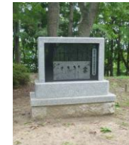
○安寿と厨子王伝承碑 (渡利字椿館地内)