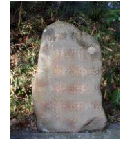
○信夫渡碑 (春日神社境内)