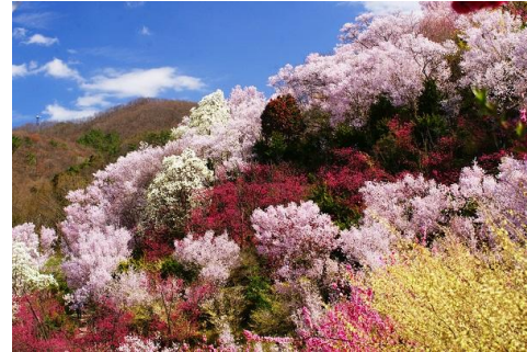
福島県の桃源郷「花見山」