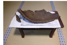
○模擬原爆の破片(※) (保管場所：瑞龍寺)