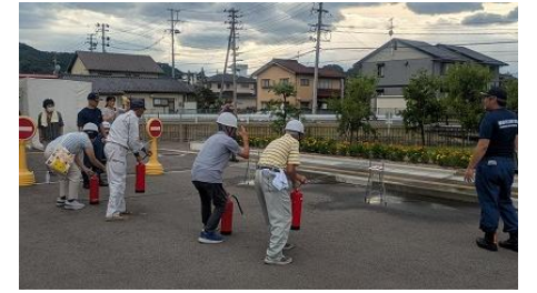
4町会合同自主防災訓練の様子