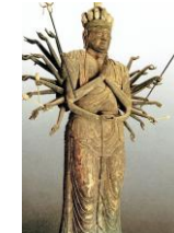
○木造千手観音菩薩立像 (大蔵寺)