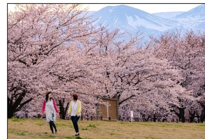
【吾妻連峰を背に花満開の荒川桜つつみ河川公園】