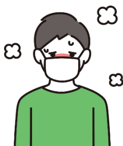
発熱 (一度下がった熱が再び上がる)