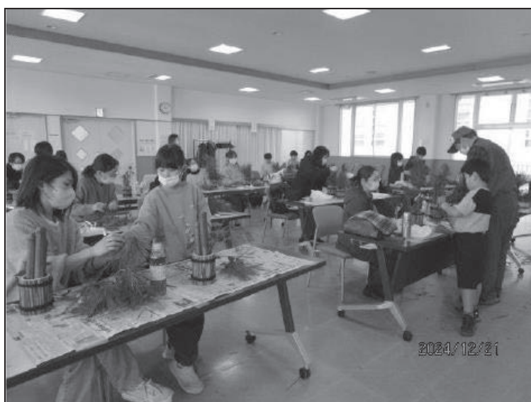
「ミニ門松づくりに挑戦！」（東部地区）