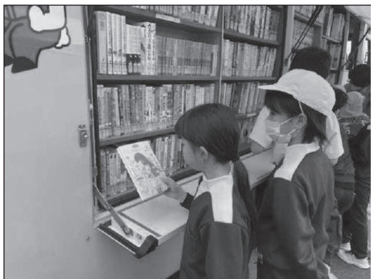
「読書推進活動」（金谷川地区）