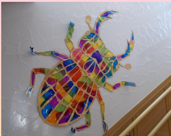
ステンドグラス（くわがたむし）