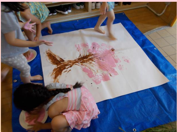
フィンガーペインティング

思わず挑戦したくなるような環境を整え「何を作りたいか」「どんな活動をしたいか」子どもたち自身が話し合い、考えて活動を行い、 芸術の要素 に触れることで「想像力」「発想力」「主体性」「自主性」などが育まれました。