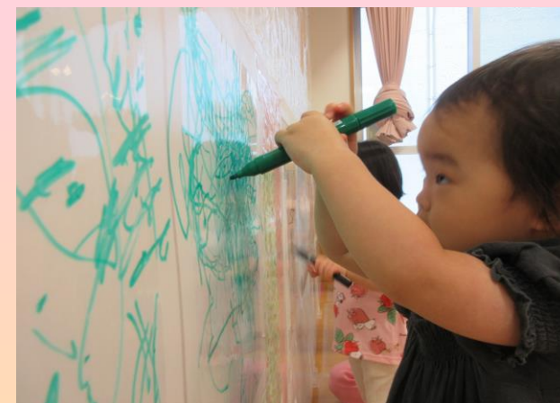
自由な発想の“なぐりがき”