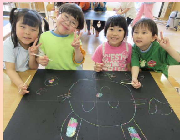
スクラッチアート