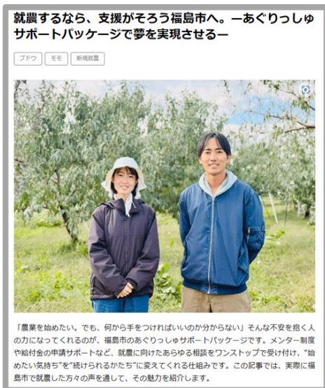
令和7年度 ◀ 掲載例

（株）マイナビが運営する農業のポータルサイト「マイナビ農業」を活用し、特集記事として「移住就農者やあぐりっしゅサポート事業活用者の体験談等」を掲載する。（10月頃掲載予定）本市農業の特色や新規就農支援メニューなどを広く情報発信することで、本市を就農地として選択する契機とする。