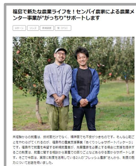
令和6年度 ◀ 掲載例