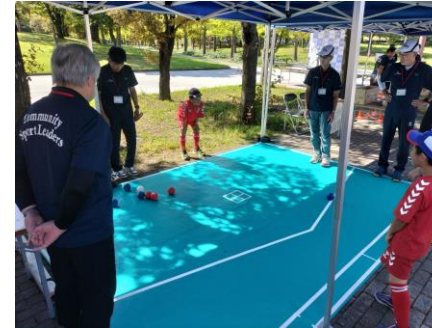
パラスポーツ体験事業