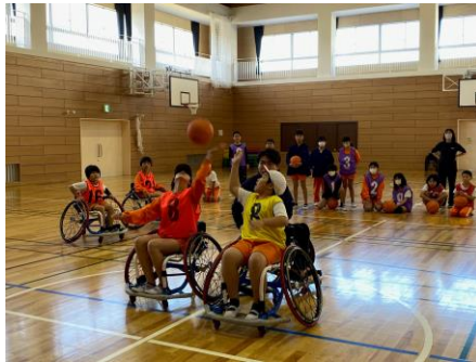
パラアスリート派遣事業