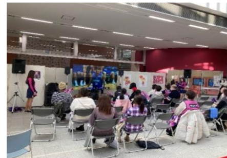
パブリックビューイング