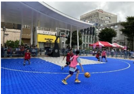
3×3バスケットボール大会

街なか広場での小・中学生を対象とした3×3バスケットボール大会や、こむこむ館等でパブリックビューイングを開催することで、街なかの賑わいと市民のスポーツ参画機会の拡大を図る。