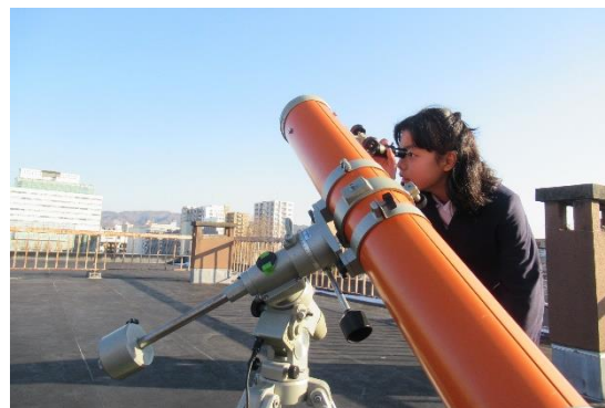
小学校理科の授業（月の観察）の様子

市民一人一人が、自己の人格を磨き、豊かな人生を送ることができるよう、生涯にわたって生き生きと学べる生涯学習社会の構築を目指し、学習機会の拡充と環境の整備を推進します。