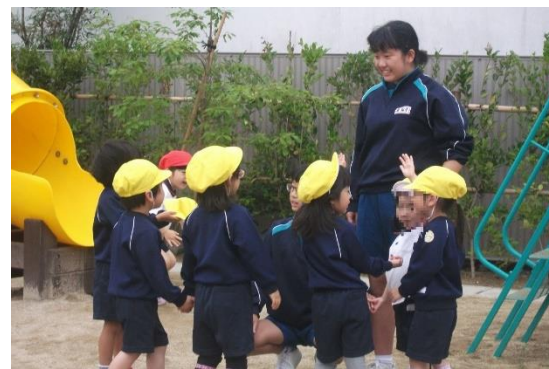
幼稚園での職場体験活動