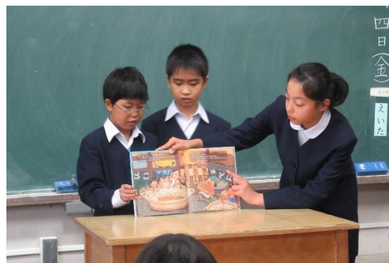
学校における読書活動