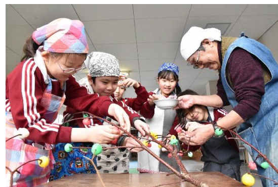
総合的な学習の時間（だんごさし）の様子