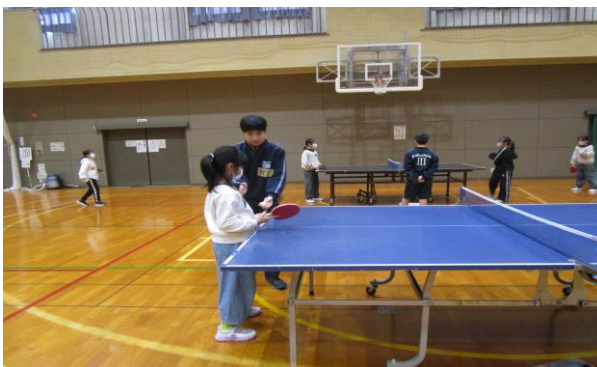
卓球教室 (福島三中)