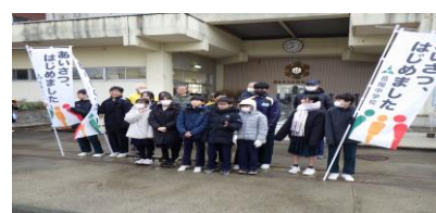
地域の方々と一緒に行った朝の挨拶運動(岳陽中)