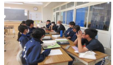
8・9年<総合> まつかわ学