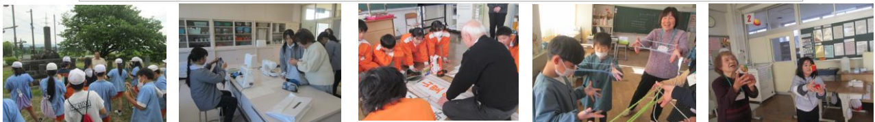
学習ボランティアによる学習支援(地域の歴史学習、ミシン補助、書初め指導、昔遊び)