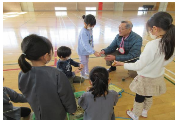
むかしあそび(鎌田小)