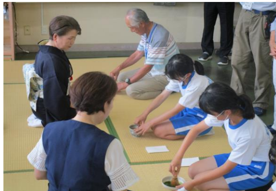
茶道体験教室(矢野目小)