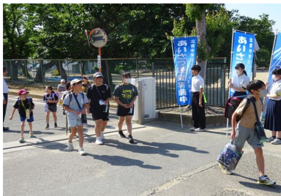
(鎌田小学校) 朝のあいさつ運動 (瀬上小学校)