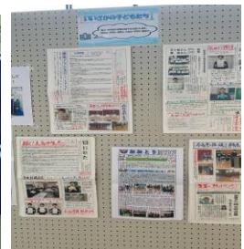
学校だより掲示 (大島中学校・飯坂小学校)