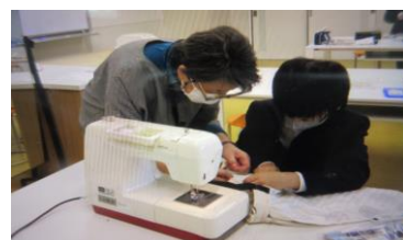
5・6年<家庭> ミシン学習