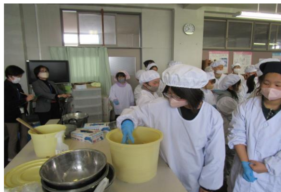
味噌づくり視察(瀬上小)