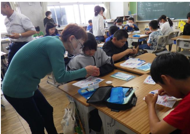
6月 家庭科ボランティア(5年生)