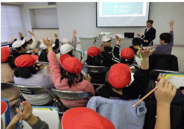
11月 学習センター見学(2年生)