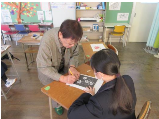
サポートルームでの切り絵教室 (信陵中学校)