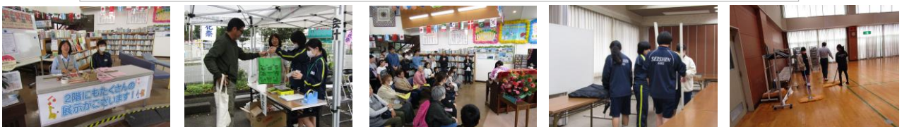
文化祭での地域協働活動(受付、バザー販売、ピアノ発表、片づけ等)