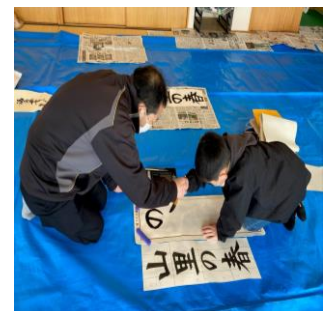
わたり寺子屋 「書初めを仕上げよう！」