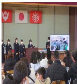
世代間交流事業 (西根中学校・湯野小学校)