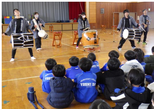
11月 総合的な学習の時間「和太鼓」(4年生)