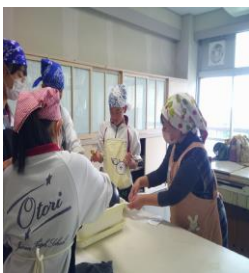
家庭科調理実習補助 (大島中学校)