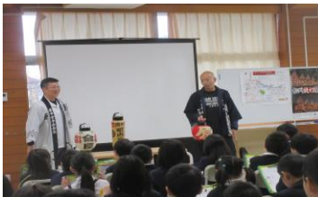
3年<総合> 松川提灯祭り