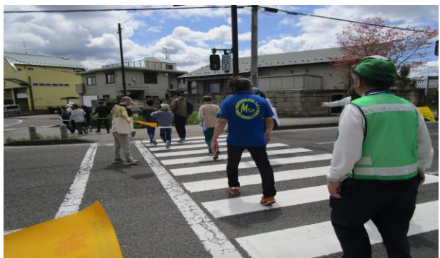
避難訓練 (支援学校 小学部)