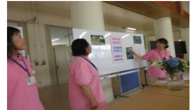
3年<総合> あじさい祭り