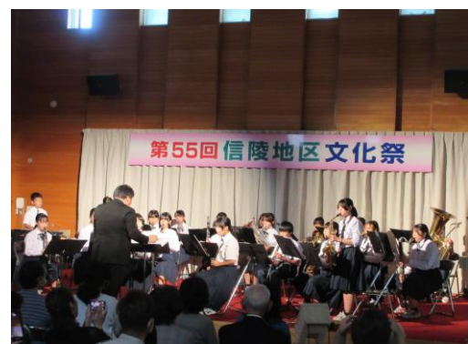
地区文化祭でのステージ発表 (笹谷小学校・信陵中学校)