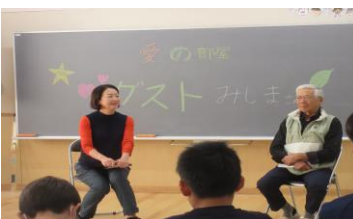
5年<総合> 地域環境学習