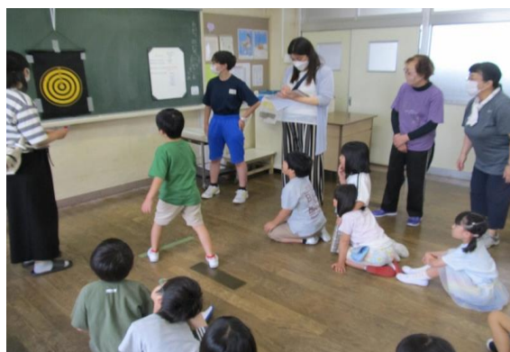
地域交流活動(余目小)