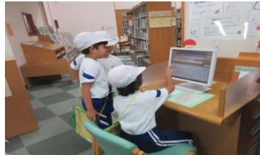
2年<生活> 学習センター見学