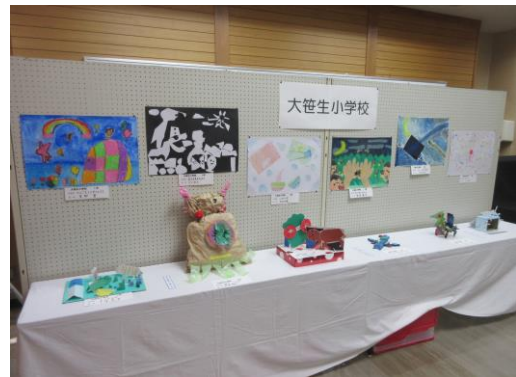
地区文化祭での作品展示 (大笹生小学校)