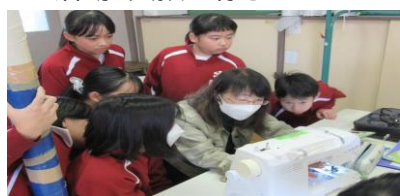
ミシンの授業支援(三河台小)