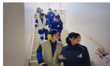
8年<家庭> 高齢者体験