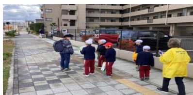
「まち探検」の授業支援(三河台小)