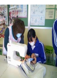
家庭科ミシン補助 (飯坂小学校)