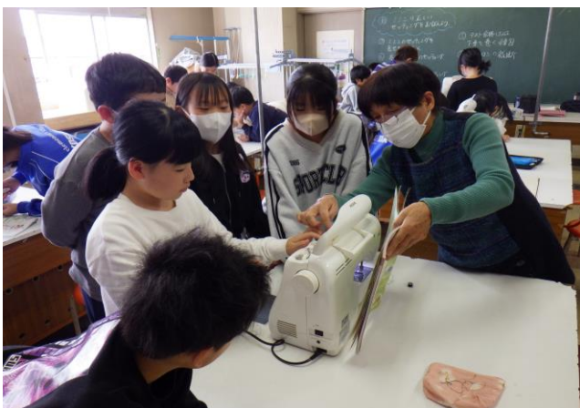
11月 ミシンボランティア(5年生)