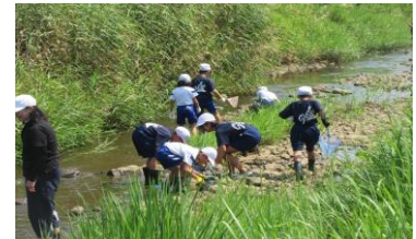
4年<総合> 水原川フィールドワーク