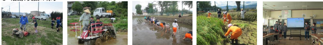
地域の方々の協力により行われた各小中学校での米作り活動の様子(田おこし、田植え、稲刈り、研究発表会)