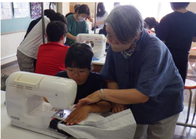
7月 ミシンボランティア(6年生)