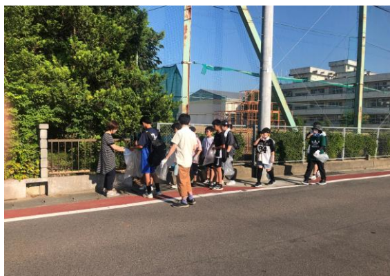
(余目小学校) クリーン活動 (矢野目小学校)