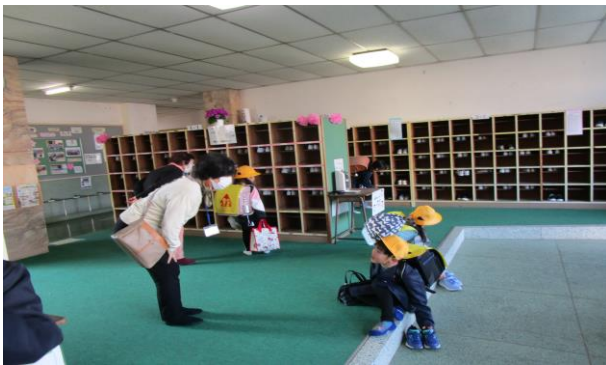
1年生入学時支援 (岡山小)