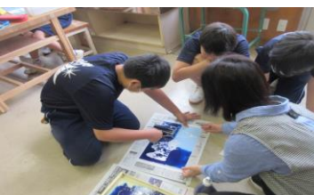
6年<図画工作> 版画学習