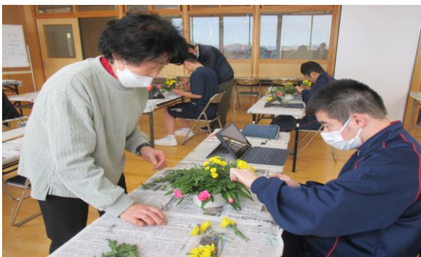
フラワーアレンジメント (支援学校 高等部)