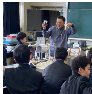
渡利中 1学年 「職業人に聞く会」