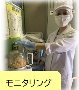
モニタリング 検査職員