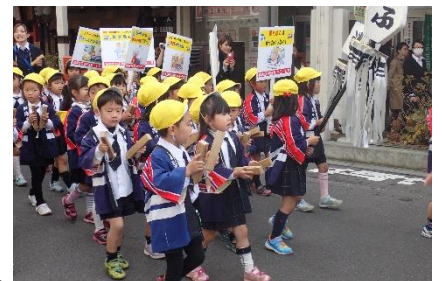
平成27年度防火パレード