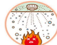
スプリンクラー設備