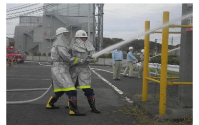
平成27年度火災防ぎょ訓練 訓練場所:日東紡績(株)福島工場