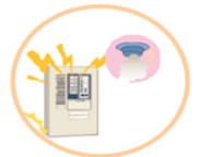
自動火災報知設備