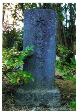
大森村 大正9年人口 2,586人 円通寺の山門前に移設