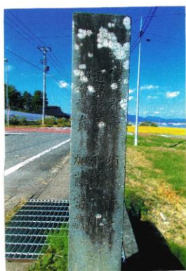
荒井村 大正9年人口 1,893人 自増橋 みなし道路元標