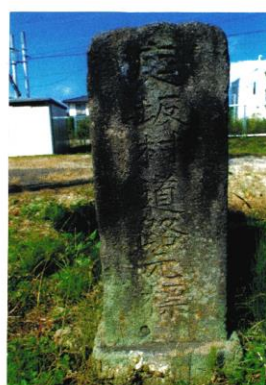
庭坂村 大正9年人口 2,539人 藤坂宿田本陣跡にある