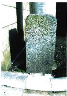
笹谷村 大正9年人口 2,082人 笹谷市民センター広場