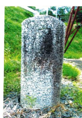
下川崎村 大正9年人口 2,854人 下川崎郵便局前消防団前