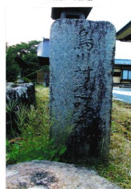
鳥川村 大正9年人口 2,271人 観音寺の山門前に移設