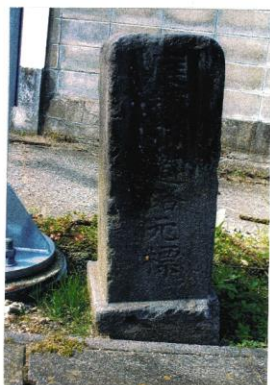
庭塚村 大正9年人口 1,679人 五十浜橋バス停付近路傍