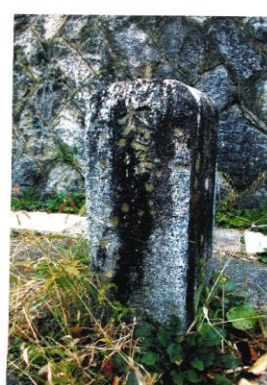
大久保村 大正9年人口 1,856人 大久保小の石壇前にある