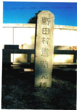
野田村 大正9年人口 5,492人 吾妻支所前の広場に移設