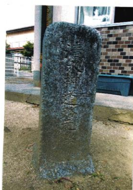
清水村 大正9年人口 3,469人 清水公民館分館前広場