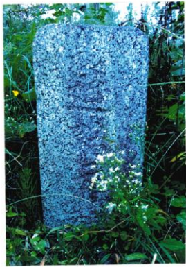
金谷川村 大正9年人口 2,920人 金谷川体育館前の広場