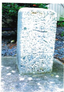
松川村 大正9年人口 3,145人 新荷神社の境内に現存