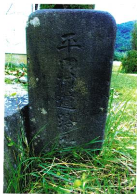
平田村 大正9年人口 2,829人 平田バス停に近い路傍