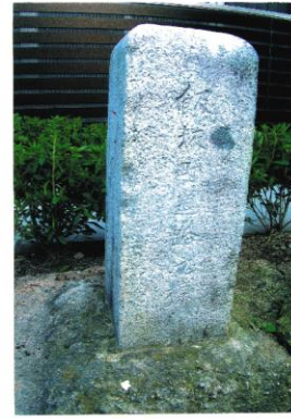
飯坂町 大正9年人口 5,068人 飯坂温泉山神社交差点