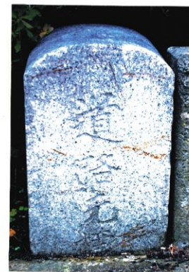
茂庭村 大正9年人口 1,467人 中茂庭の支所前に現存