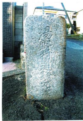
湯野村 大正9年人口 3,953人 湯野市民センターの入口