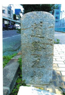
福島市 大正9年人口 35,767人 県庁前通り 旧松又前