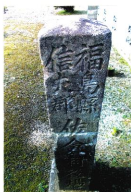
佐倉村 大正9年人口 3,241人 忍魂峠前 みなし道路元標