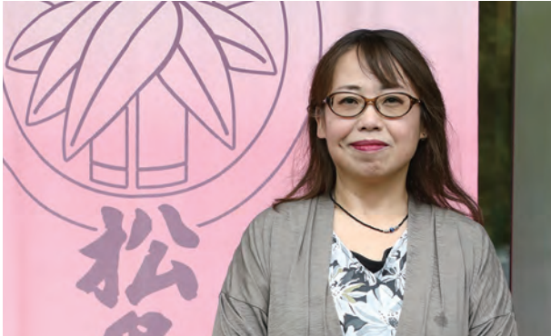
飯坂温泉松島屋旅館 女将