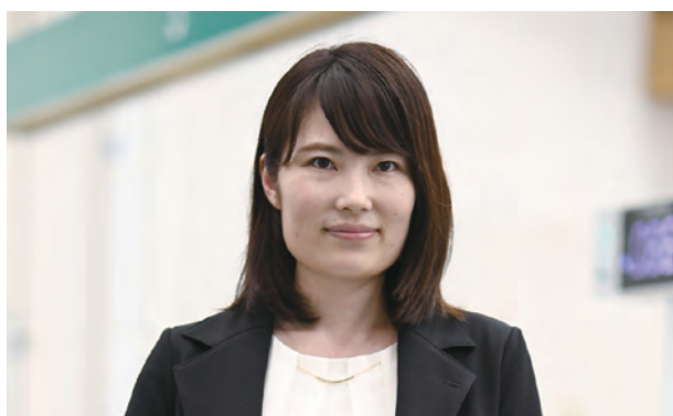
福島信用金庫 職員