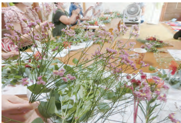
ママカフェでおしゃべりしながらのスワッグづくり

自分たちで調べた中で自主避難者を受け入れていた県は、山形県、新潟県、秋田県でした。その中で、まず山形県に問い合わせましたが、定員になり受け入れられないとのことで、家族と話し合い秋田県の県南の方にすることに決めました。夫は仕事がありましたので福島市に残り、2011年の夏休みに私と子どもたちで避難しました。避難してからは、月に多くて2回くらいしか家族そろって会うことが出来ませんでした。