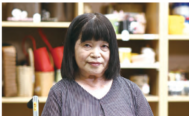
共同作業所 ぼけっと 代表 特定非営利活動法人 えいど福島 理事長