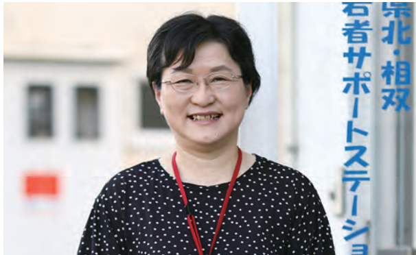
特定非営利活動法人ビーンズふくしま 理事長