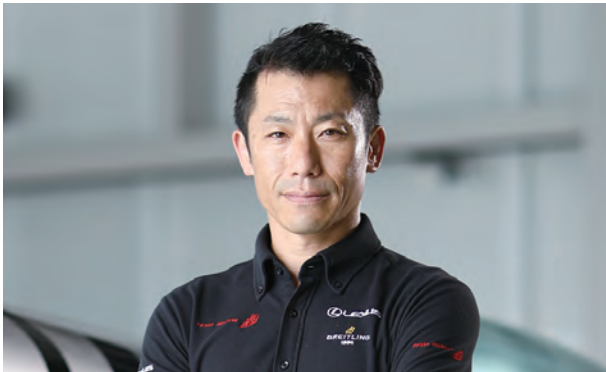
エアレース・パイロット/ エアロパティック・パイロット