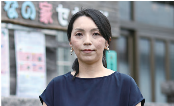
ふくしま子ども支援センター 職員