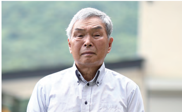
飯野・明治仮設住宅飯舘自治会 前会長