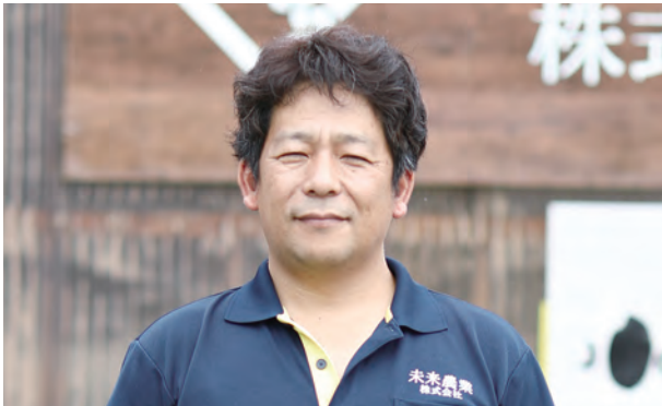
未来農業株式会社 代表取締役 農業組合法人 福島未来農業生産組合 代表理事