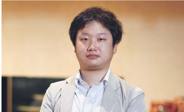
土湯温泉山水荘 若旦那