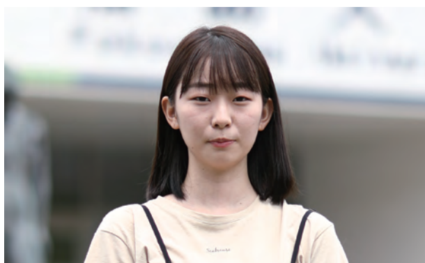
福島大学3年生 人文社会学群人間発達 文化学類 文化探究専攻 在籍