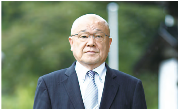
大波地区自治振興協議会 前会長