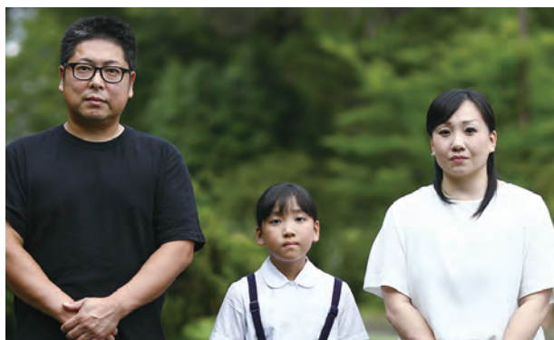
福島市立福島第三小学校4年生