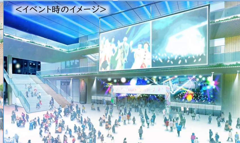
<イベント時のイメージ>