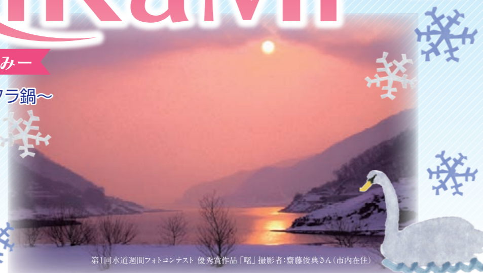
第1回水道週間フォトコンテスト 優秀賞作品「曙」

福島市水道局だより「SuRiKaMi」。今回は第3号！ 水道局からのお知らせやあったか鍋の作り方、風邪の予防など、 情報が満載ですよ。この冬を健康で元気に過ごしましょう。