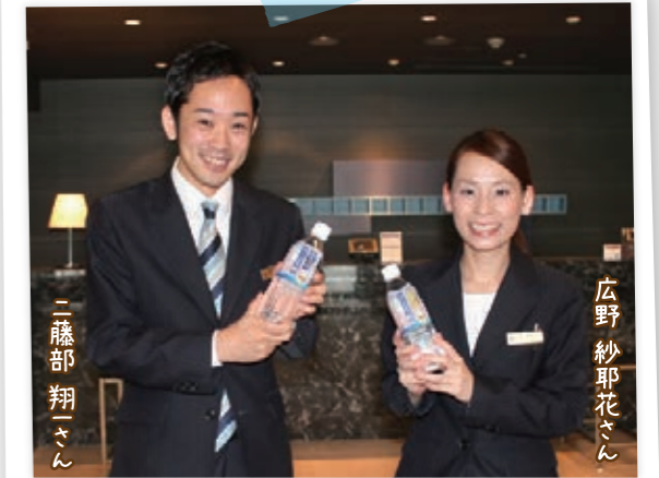
スタッフの皆さんがステキな笑顔で迎えてくれます。ペットボトル「ふくしまの水」を手に、「ようこそ、福島へ!」

ホテルの厨房で使用するのも、もちろん水道水。「地元の水は、地元食材との相性も抜群」と、料理長たちも満足げ。地元の良質な水をいつでも当たり前に見えるのは、本当に幸せなことですね。