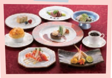
忘年会・新年会に向けて12月から1月のパーティーメニューの一例。