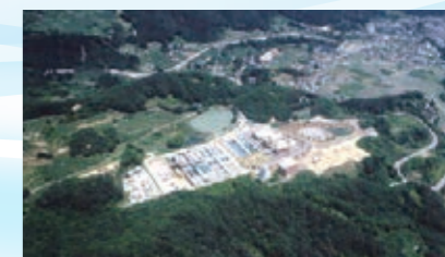
▲すりかみ浄水場（福島県地方水道用水供給企業団）

摺上川ダムによる水 源確保に向け、平成元 年、福島県地方水道用水供 給企業団からの受水を 基本とした第8次拡張 事業に着手、南部受水地 ほか企業団からの受水 地点新設などを行い、 完成に20年以上の歳月 と巨額の費用を投じた 一大事業でした。 ダム完成後、平成19年 に本格受水を開始。これ により、雨の降らない状 態が長期間続いても約 400日分の水道水を 確保でき、天候不順から の水不足を解消するこ とができました。また、 水源を阿武隈川から摺 上川としたことで良質 な原水が確保され、おい しい水をお届けできる ようになりました。