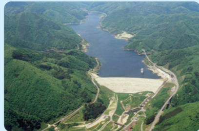
▲完成に20年以上の歳月と、巨額の費用を投じた「摺上川ダム」

福島市の水道水は摺上川ダムを水源とする福島地方水道用水供給企業団から受水しており、水道料金はその受水費の影響を大きく受けています。 今回はその受水費が引き下げられたことから、今後、人口の減少に伴う水道料金収入の減少や水道施設の更新に多額の費用が見込まれる中(前号VOL.3を参照)ではありますが、値下げが可能となりました。