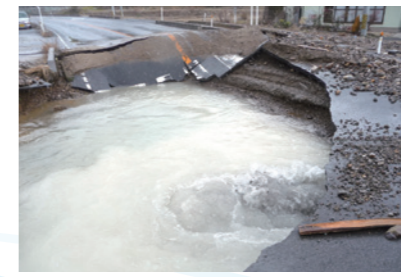
地震により破損した1500mm送水管(福島地方水道用供水企業団)の漏水状況(右)と補修状況(左)