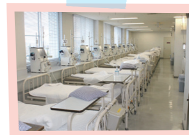
1度に36人の人工透析ができる広々とした透析室