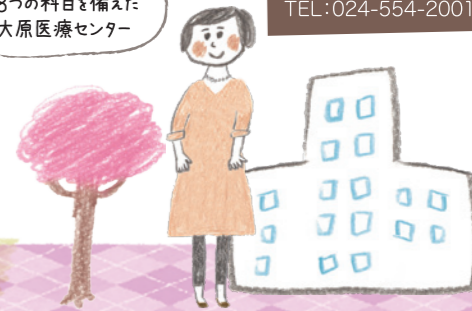
大原医療センター 福島市鎌田字中江33 TEL:024-554-2001(代)