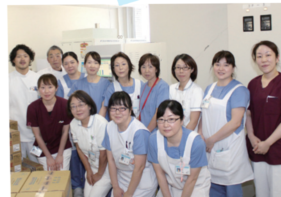
臨床工学科、透析室スタッフの皆さん

透析患者さんは水分制限が厳しく、少ししか水を飲めません。だからこそ、福島の水のおいしさをとて喜んでいきます。飲料水としてはもちろん、医療の現場でも役立ち、欠かせない福島の水。これからも大事に使っていききたいですね。