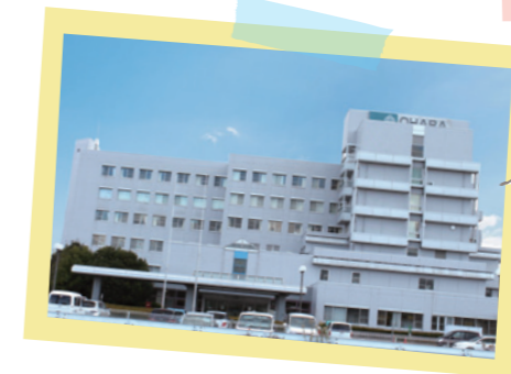
腎臓内科をはじめ8つの科目を備えた大原医療センター