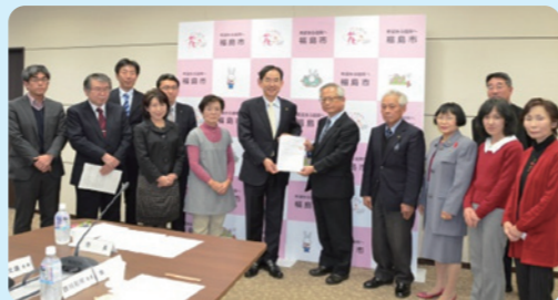
▲「水道料金のあり方」は、長期的な視点で判断する必要があることから、今後の100年を見据えて策定した「ふくしま水道事業ビジョン 福島市水道事業基本計画 2016」と収支の見直しを示した「財政計画」を元に審議していただきました。