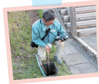
検針は2カ月に1度。盗水、漏水を発見するため、空き家などのメーターもすべて確認しています。