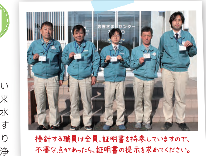
検針する職員は全員、証明書を持参していますので、不審な点があったら、証明書の提示を求めてください。