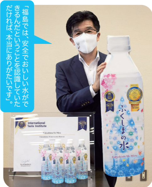
「福島では、安全でおいしい水が飲めるんだという認識を認めていただけは、本当にありがたいです。」