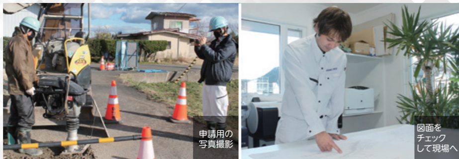
申請用の写真撮影