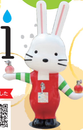
ももりんウォーター 商標登録 第6415941号