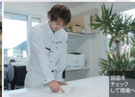
図面をチェックして現場へ