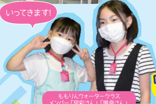
ももりんウォータークラス メンバー「早彩さん」「唯奈さん」

「ももりん ウォータークラス」に 関するお問い合わせ 水道総務課 TEL 024(535)1116