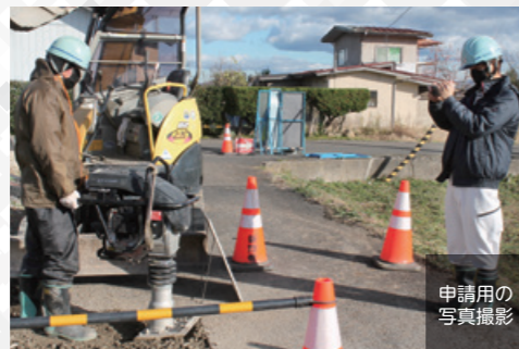
申請用の写真撮影