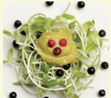
▲スプラウトを使ったサラダ

水だけで植物を育てる「水耕栽培」。この季節におすすめなのが、「スプラウト」です。スプラウトとは発芽直後の新芽のこと。キッチンで育てて、手軽にサラダやスープに使ってみませんか? 代表的なスプラウトが、豆苗、ブロッコリー、かいわれチゴの器や、ペーパータオル、厚めのティッシュペーパー、脱脂綿などを敷き、培地が浸るくらいの水を入れます。その上に重