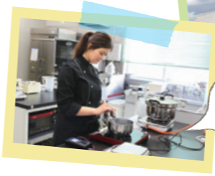
焼き菓子の生産も開始。さらなる新商品の開発に取り組んでいます。

トーニチ株式会社 福島市瀬上町字新田中通1-3 TEL:024-552-2161