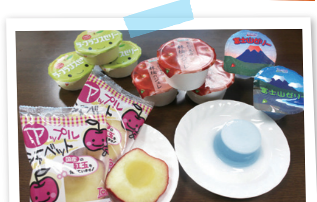
「トーニチ」で製造しているフローズンフルーツやゼリー。今後は、インターネット販売もスタートする予定です。