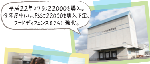
平成22年よりISO22000を導入。今年度中には、FSSC22000を導入予定。フードディフェンスをさらに強化。

原料水はすべて水道水 工場では、水道水と井戸水を使い分け、機械などの洗浄には井戸水を使っていますが、製品の原料水はすべて水道水。