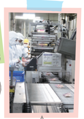
この日は、東北産の白桃をコンポートしたフローズンフルーツを製造中。