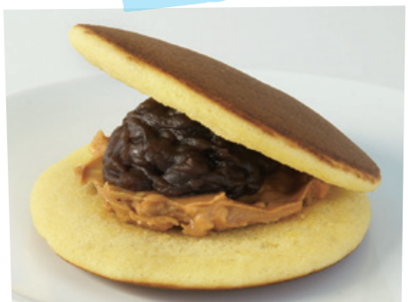
人気No.1の「落花生」。 濃厚なピーナツバターのコクと、 落花生のつぶつぶとした食感がクセになる逸品

丹坊 本店 福島市丸字字漆方18-9(福島商業高校通り沿い) TEL:024-563-3926 営業時間/10時~18時 定休日/水曜日 丹坊 工場直売店 福島市成川字杵清水36-1(国道115号線沿い) TEL:024-573-0147 営業時間/10時~18時 定休日/火曜日