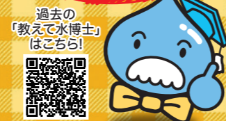
過去の「教えて水博士!」はこちら!

財政計画の内容は「教えて水博士!」水道料金の事(VOL10~12)と同じように経営審議会を通してみんなの意見を取り入れて決めているんじゃ!