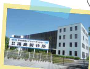
1920年創業。2020年に100周年を迎える機械メーカー福島製作所。

株式会社 福島製作所 福島市三河北町9番80号 TEL:024-534-3146