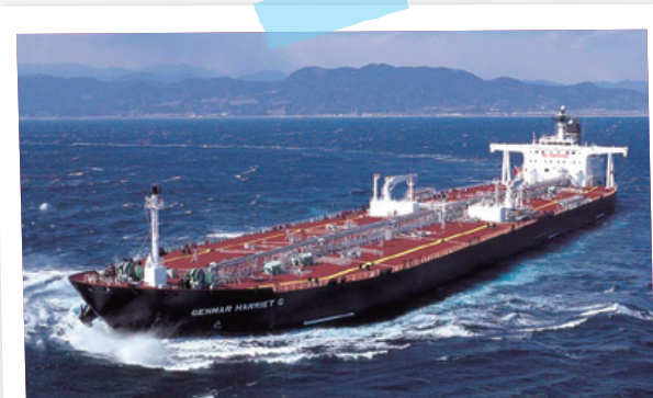
福島製作所の「甲板機械」は世界中の海を航行する船に搭載されています。

長年、福島を拠点に成長してきた「福島製作所」。世界の大海原で活躍する製品に、福島の水道水が役立っているのは、誇らしいですね。