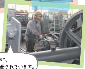
確かな技術力が、世界で高く評価されています。