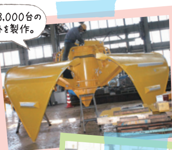
これまで、約3,000台のグラブバケットを製作。