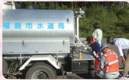
※相双地域での給水活動状況

福島市水道局では水を運べるタンク車、2tを3台、1.8tを1台、車両に積載し水を運べる1tタンクを23台保有しています。