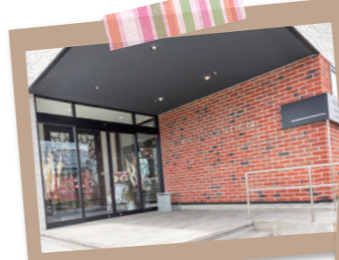
レパコガーデン本店 福島市下鳥渡八幡塚2-3 TEL:024-545-6844 営業時間/テイクアウト:10時~19時 イートイン:11時~19時 (ラストオーダー18時)