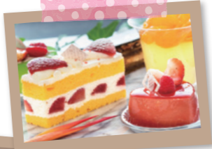
厳選素材を使い、1つ1つ丁寧に作り上げられます。2月、3月は、バレンタインデー、ホワイトデーの限定品が登場。