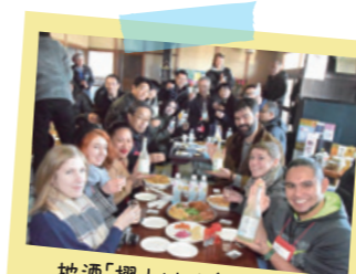
地酒「摺上川」を楽しむ会が開催され、味わいを堪能。