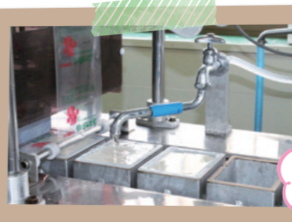
パッケージするときも、福島の水をたっぷり充填。