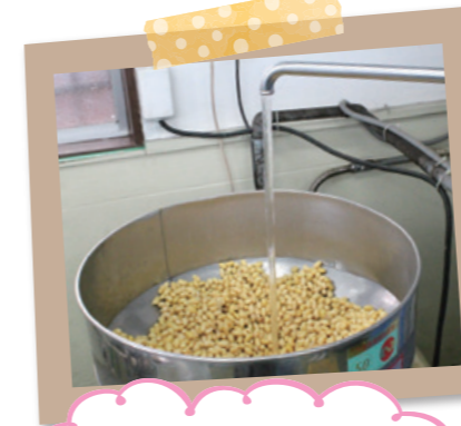
一晩水に浸した大豆に水を加え、すりつぶします。大豆は宮城県産の「ミヤギシロメ」と山形県産の「里のほほえみ」をブレンドして使用。