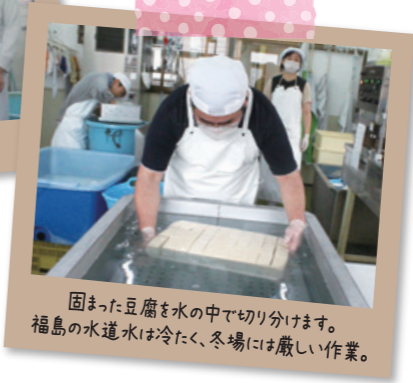
固まった豆腐を水の中で切り分けます。福島の水道水は冷たく、冬場には厳しい作業。