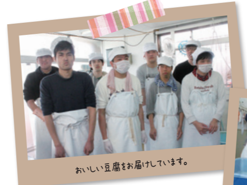
おいしい豆腐をお届けしています。

商品は木綿豆腐、寄せ豆腐、ざる豆腐のほか、おから、豆乳も販売しています。工房隣の売店、ヨークベニマル矢野目店、伊達駅売店で購入できます。