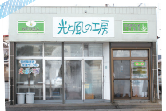
工房隣の売店で販売中。開店直後だと、出来立てが味わえます。

光と風の工房 福島市北矢野目字金湊28-17 TEL: 024-553-6902 営業時間/10時~15時 定休日/土・日・祝日