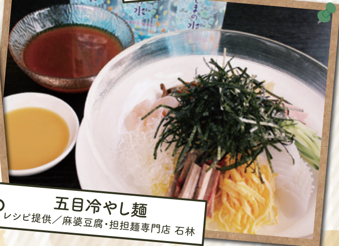
五目冷やし麺 レシピ提供/麻婆豆腐・担担麺専門店 石林