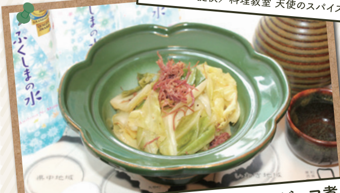
キャベツのコンビーフ煮 レシピ提供/和食美酒 たつみ