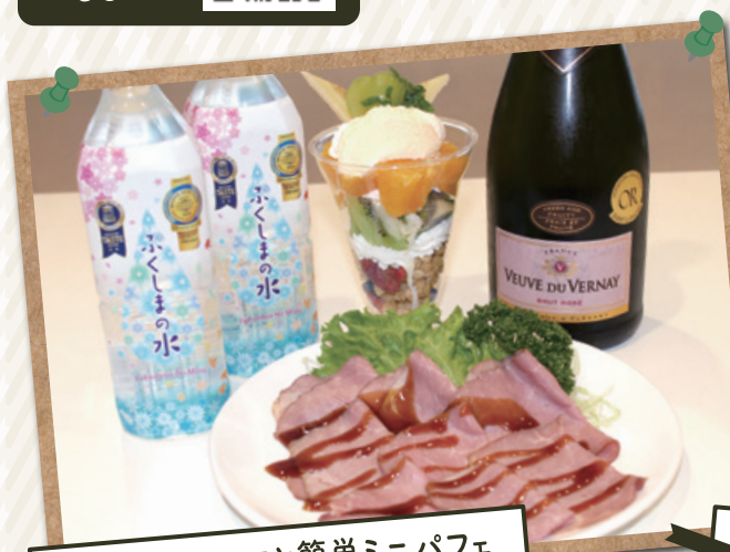
ローストビーフと簡単ミニパフェ レシピ提供/いちい FOUR'S MARKET 山下店