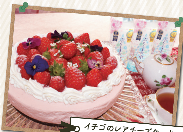
イチゴのレアチーズケーキ レシピ提供/料理教室 天使のスパイス

※ご紹介いただいたレシピ・ 店舗名は取材当時のものです。 ※店舗メニューにない 場合がございます。