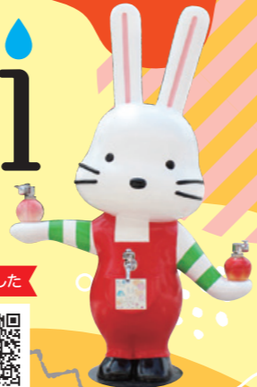
ももりんウォーター 商標登録 第6415941号