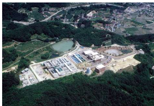
写真：すりかみ浄水場