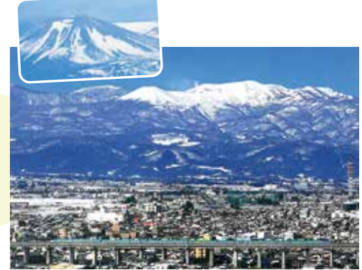
吾妻山の雪うさぎ

雄大な吾妻連峰から感じる自然 四季の移ろいを感じられる吾妻山は、市内各所から眺めることができ、市民の心のやすらぎにもなっています。