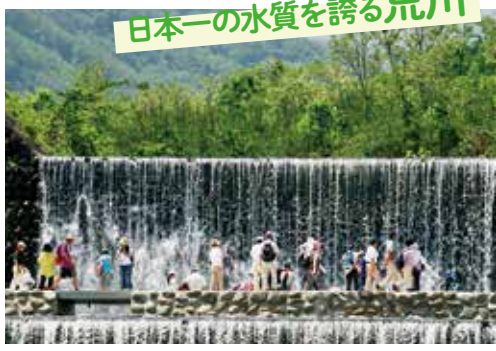
日本一の水質を誇る荒川

荒川は国土交通省の河川水質調査で「水質が最も良好な河川」と評価され、10年連続で水質日本一に選ばれています。清流を間近で体験できる「地蔵原堰堤」は特におすすめ!