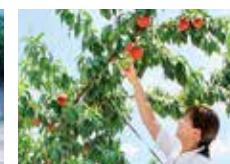
●夏の日差しで色づく果実(桃狩り)