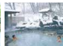
●雪見風呂(野地温泉)