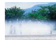
●真夏の水遊び(十六沼公園)