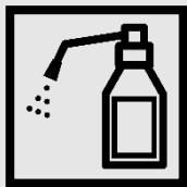
出入り口での 手指消毒