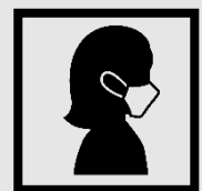
マスク着用と 咳エチケット