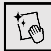
触れやすい 場所の消毒