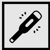
入場時の 体温測定