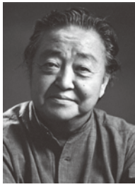
秋山 庄太郎 あきやま・しょうたろう

(1920～2003) 東京・神田生まれ。女優ポートレートを数多く手がけ、第一線に立つ写真家としての地位を不動のものにする。さまざまな写真関連団体の重職を務め、写真文化の発展に尽力。ライフワーク「花」により写真芸術の大衆化に貢献。1970年代以降、当時「知る人ぞ知る」地であった福島市郊外の花見山公園を「桃源郷」と絶賛し、同園の名を全国に広めた。1986年紫綬褒章、1993年旭日小綬章を受章。2001年福島市ふるさと栄誉賞を受賞。