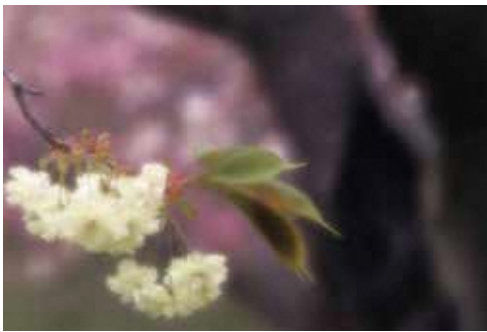
花見山公園にて(1994年)