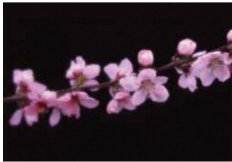
花見山公園にて(1989年)