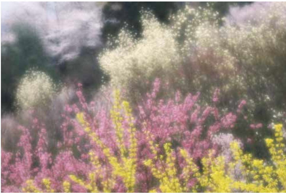
花見山公園にて(1990年頃)