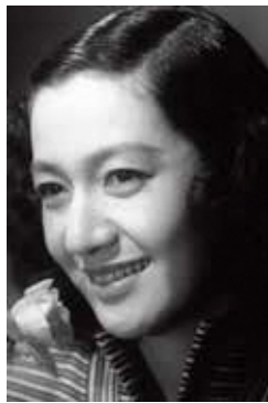
原節子(1950年頃)