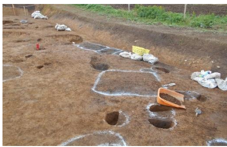
▲時間の経過とともに皆さんが掘った跡が増えていきます