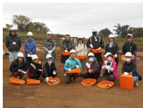
▲道具を持って記念写真