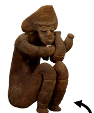
国重要文化財「しゃがむ土偶」 (上岡遺跡出土)

昨年好評だった 「女子会」や「まちかど 博物館」も引き続き開催♪ 新企画もお見逃しなく！