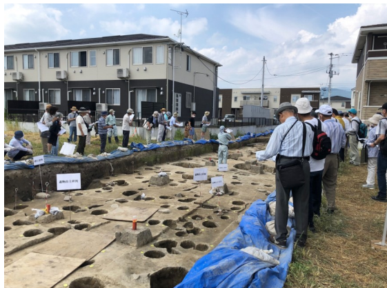
▲現地説明会の様子

Vol.17で紹介した「宮代館(みやしろたて)跡」ですが、7月22日(木・祝)に現地説明会を行いました。今回の調査では、中世館跡の一部と思われる掘跡や、奈良時代の竪穴住居跡のほか、数多くのかかわりが出土しています。福島市内でこれほどの量のかかわりが出土する遺跡は他になく、宮代館跡は平安時代末期から鎌倉時代における福島市域(当時は信夫庄と呼ばれていました)の政治的な拠点であったと考えられます。