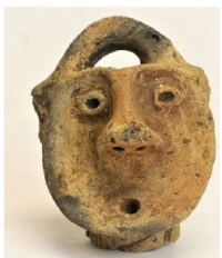
非公認 藤権現遺跡キャラクター「ふ〜じ〜」

ぜひコラボしたい！と思った我々は、すぐ喜多方市の担当の方へ連絡をとり、快諾いただきました。コラボ企画として、今回は「しゃがむ土偶ぴ〜ぐ〜ダタバタ日常劇」に登場していますので、ぜひチェックしてくださいね！