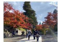
▲文知館前産の紅葉が見ごろを迎えていました♪