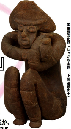
国書文化財「しゃがむ土偶」(上田藩御出土)