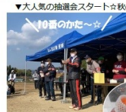
▼大人気の抽選会スタート☆秋のフルーツセットをプレゼント♪