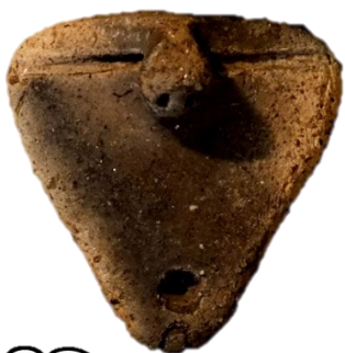
←月崎A遺跡出土土偶(縄文中期) ほんものはこちら！