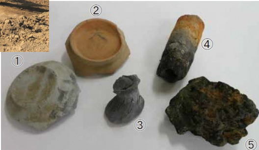
▼今年度の調査で出土した土器等