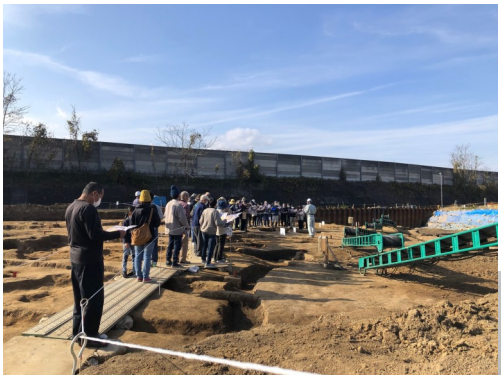
◀ 現地説明会の様子

令和元年6月から調査を実施しています。今年度の調査では令和元年度にみつかった奈良・平安時代とほぼ同時期の遺構・遺物が確認されました。また、鎌倉時代・近世の遺構や遺物もみつかっています。