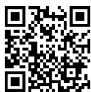
福島市写真美術館の巻