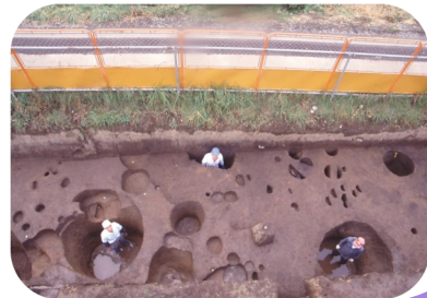
↓ 直径90cmの柱が埋められていたと考えられる柱穴跡