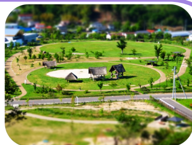
↑ じょーもぴあ宮畑全景