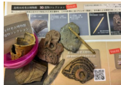
▲3Dプリンター製の土器ミニチュア

一方で、地元の猟師さんからもらった骨を釣り針に釣りをする体験や、出土した土器のミニチュアを3Dプリンターで作ってみたりと、自由な発想で北相木村の埋蔵文化財を活用していることを伺えました。