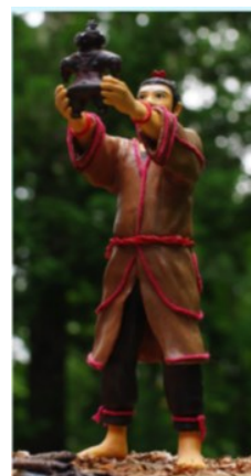
▲「特別展『縄文-1万年の美の鼓動』」で展示されたフィギュア