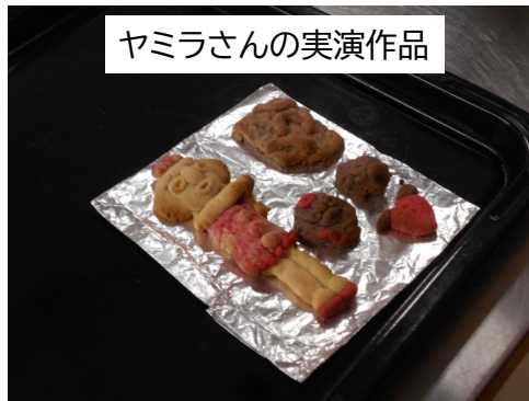
ヤミラさんの実演作品