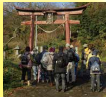
普段は見過ごしがちな、信夫山に点在する史蹟・文化財を訪ね歩きます（約8km）

◆申し込み方法 3月16日（金）（必着）までに、往復はがきの往信裏面に①住所②氏名③生年月日④電話番号を、返信表面に①住所②氏名を明記の上、じょーもぴあ宮畑まで郵送で（1人につき1枚）※受付開始 3月1日（木）