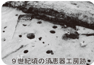
9世紀頃の須恵器工房跡