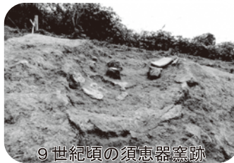
9世紀頃の須恵器窯跡