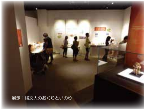
展示：縄文人のおくりといのり