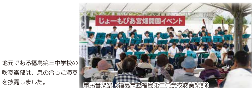
市民音楽祭（福島市立福島第三中学校吹奏楽部）

オープニングイベントでは飯坂八幡神社祭り太鼓保存会、takano&miyuki、福島市立福島第三中学校吹奏楽部、マハロサウンズ18、ニューファンタスティックジャズオーケストラが出演し、イベントに花を添えました。