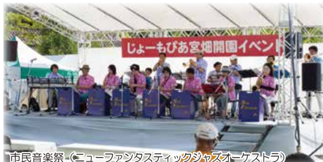
市民音楽祭（ニューファンタスティックジャズオーケストラ）

オープニングイベントでは飯坂八幡神社祭り太鼓保存会、takano&miyuki、福島市立福島第三中学校吹奏楽部、マハロサウンズ18、ニューファンタスティックジャズオーケストラが出演し、イベントに花を添えました。