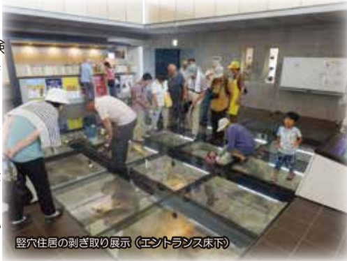
竪穴住居の剥ぎ取り展示（エントランス床下）