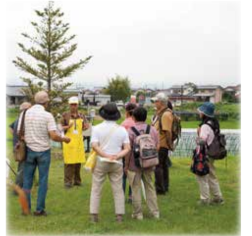
待ちに待った開園で、案内ガイドにも熱が入ります。