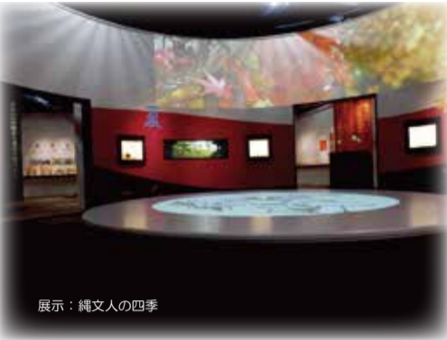
展示：縄文人の四季

また、縄文工房では様々な体験ができ、楽しみながら縄文時代の生活を学ぶことができる施設です。ホールでは縄文時代だけではなく、歴史や文化にかかわる講演会やオープンカレッジが企画されます。