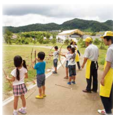
弓矢で狙う獲物は、クマ？それともシカ？