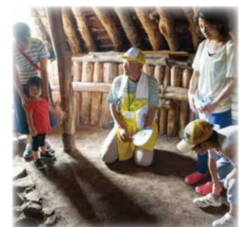
見慣れない竪穴住居に子供たちもびっくり！