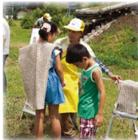
来園した子供たちは縄文服を着て、縄文人になりきりました！