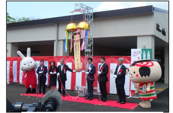
「湯楽座」と「湯愛舞台」がオープン