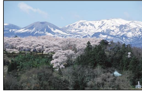
【大森城山と吾妻の雪うさぎ】